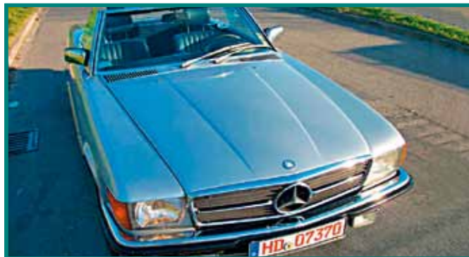
3 Mercedes-Benz 280 SL, Bj. 1984 Ralf Stumpnagel, Hermsbach Rainer Häckel, Thurnau Team BELMOT Oldtimer-versicherung