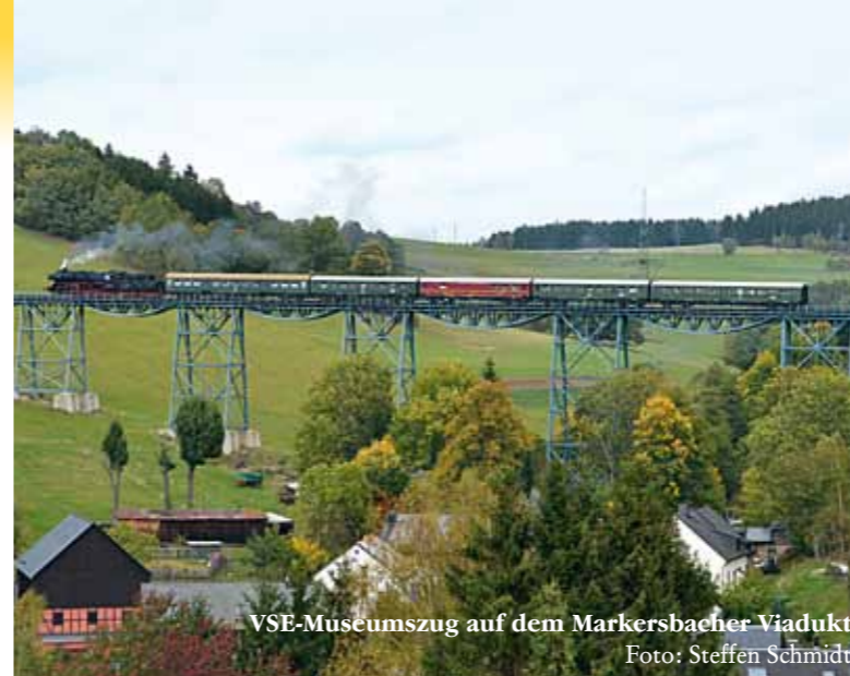
VSE-Museumszug auf dem Markersbacher Viadukt