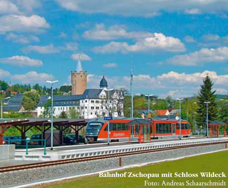
Bahnhof Zschopau mit Schloss Wildeck