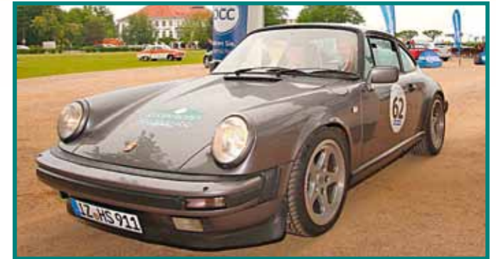
42 Porsche 911 Carrera, Bj. 1985 Holger Semmelhaack, Engelbr.-Wildnis Angela Sapatutzki, Engelbr.-Wildnis