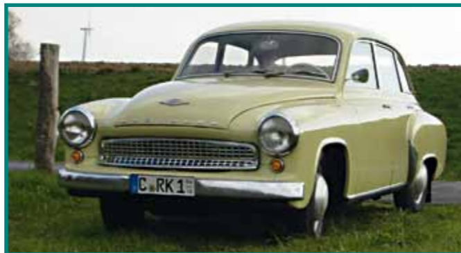
40 Wartburg 311, Bj. 1960 Dietmar Reuchsel, Chemnitz Astrid Reuchsel, Chemnitz