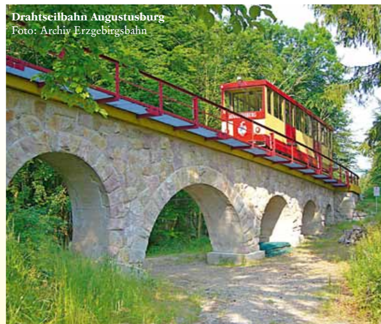
Drahtseilbahn Augustusburg