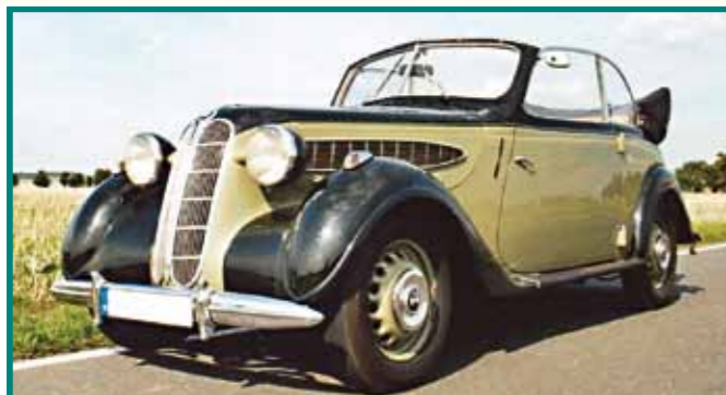
13 BMW 321/1 Cabrio, Bj. 1939 Bernd Schmiedel, Neukirchen a.d. Pleiße Hildegund Schmiedel, Neukirchen a.d. Pleiße